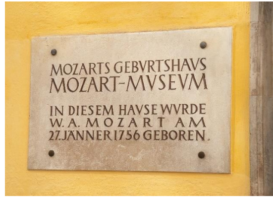
b) - ____