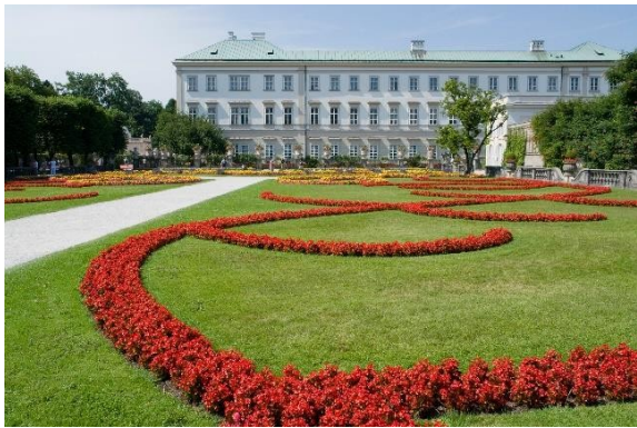
a) - ____