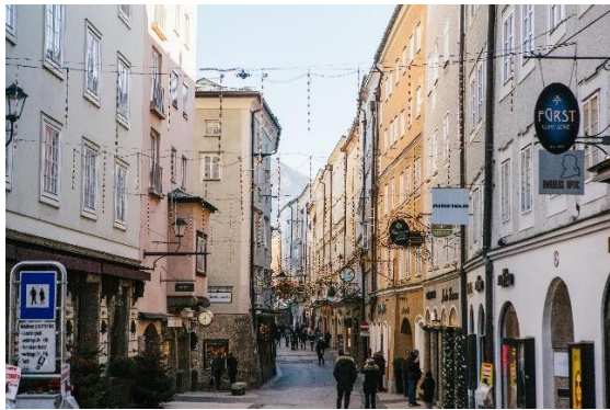
e) - ____