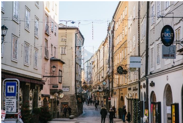
e) - ____