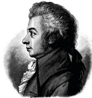
d) - ____