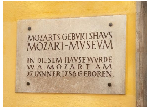
b) - ____